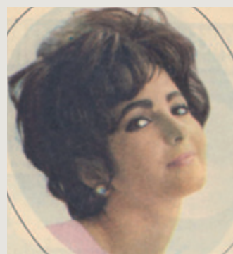
Revue Lectures d'Aujourd'hui, 12 oct. 1963