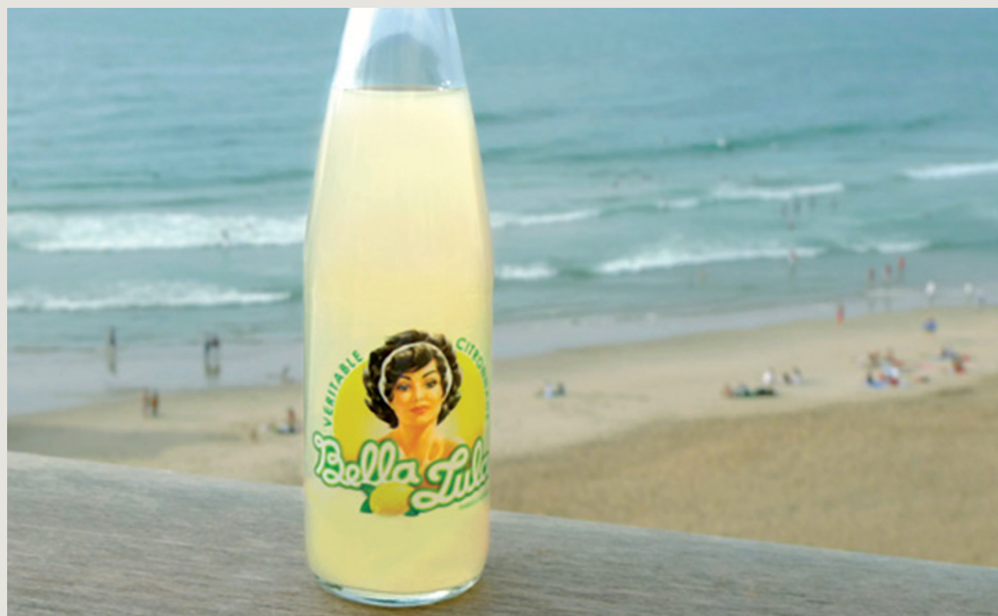
« I like - La bella Lula » photographie de Caroline Igel, Biarritz 2009