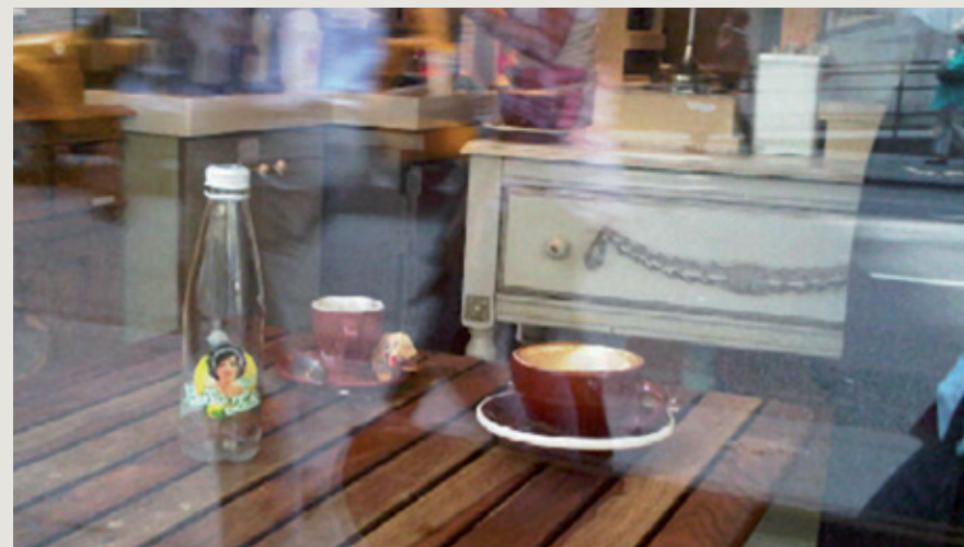
New-York, été 2010.